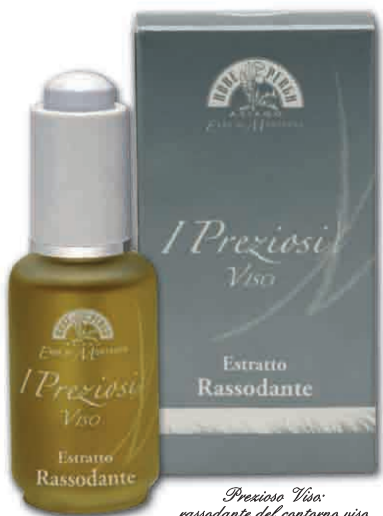
Prezioso Viso: rassodante del contorno viso e rinforzante cutaneo