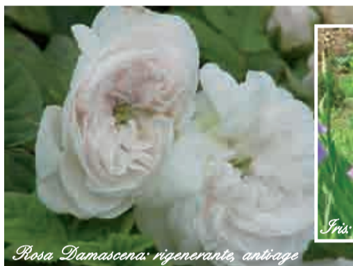
Rosa Damascena: rigenerante, antiage

Come eliminare i segni del tempo con la formula della giovinezza Höbe Pergh