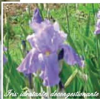
Iris: idratante, decongestionante