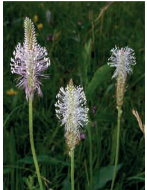
Piantaggine: depurativa, antinfiammatoria, emolliente, astringente e rinfrescante

A questa pianta, apparentemente poco importante, preziosa per le sue proprietà depurative, antinfiammatorie, emollienti, astringenti e rinfrescanti, fin dai tempi antichi le si attribuivano ampi poteri curativi. Le foglie pestate e messe a macerare con l'olio di oliva venivano adoperate per uso esterno sotto forma di cataplasma e usate per decongestionare e lenire le irritazioni cutanee e per rendere la pelle morbida e setosa.