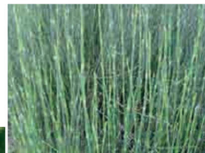
Equiseto: rimineralizzante, rassodante, elasticizzante cutaneo