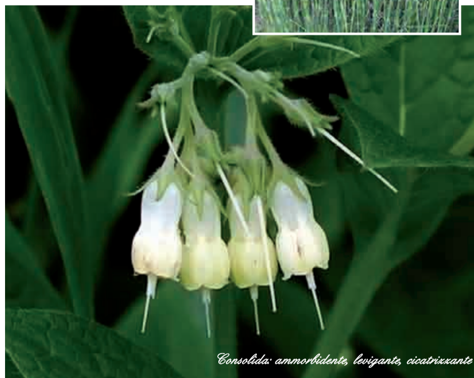
Consolida: ammorbidente, levigante, cicatrizzante