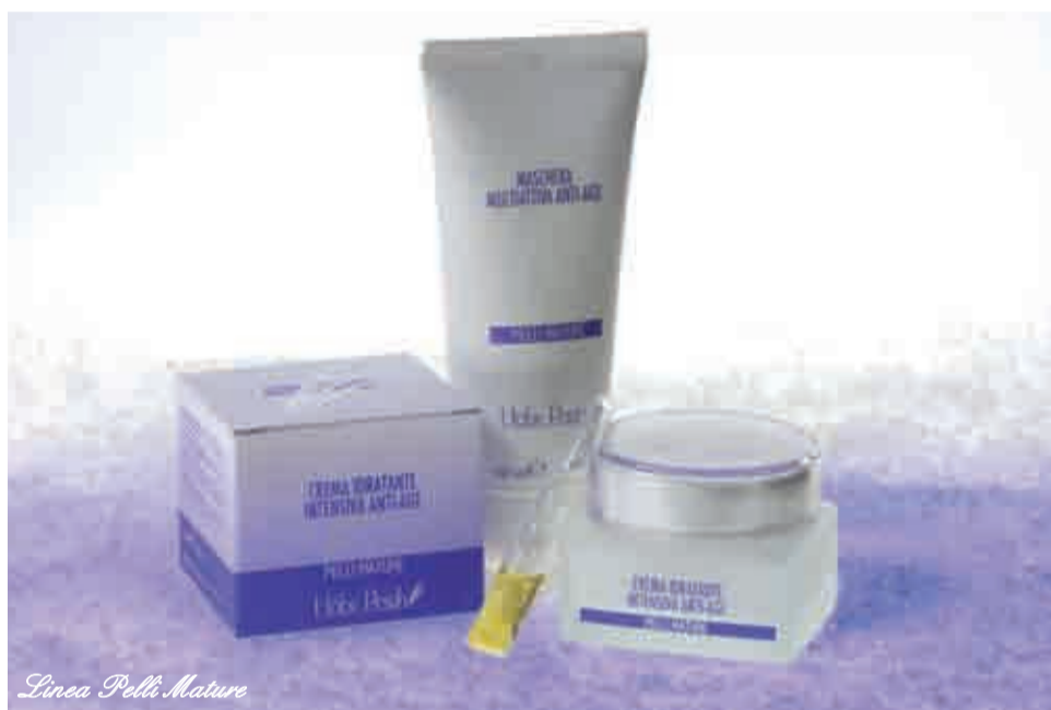
Linea Pelli Mature

E' il variopinto insieme delle piante officinali presenti nel fieno Höbe Pergh dell'Altopiano di Asiago che caratterizza la rara ricchezza di principi attivi contenuti nei nostri cosmetici.